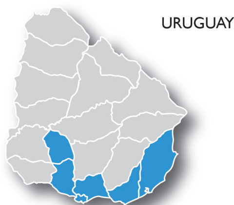
Figura 2. Mapa del Uruguay señalado con color los departamentos que enviaron formularios al INDDHH, período de julio 2020 a diciembre 2021

La ley establece que las internaciones voluntarias e involuntarias que superen los 45 días deben notificarse, así como aquellas internaciones indicadas por intervención judicial. Considerando los tiempos de internación, se encontró que, de las 38 notificaciones por internación voluntaria, 27 (71 %) tuvieron una duración menor a 45 días, y en 11 notificaciones se superó ese número de días. También se observó que en 3 de las 38 notificaciones de internación voluntaria intervino un juzgado, constatándose que en esos 3 casos se notificó de manera incorrecta ya que no corresponden a internaciones voluntarias. En las 142 notificaciones por internaciones involuntarias, 67 fueron por más de 45 días y en 91 de los formularios se registró la intervención de un juzgado, representando un 64 % del total. En esas notificaciones con intervención judicial no se brindan datos sobre el juzgado que intervino y que actuación realizó.